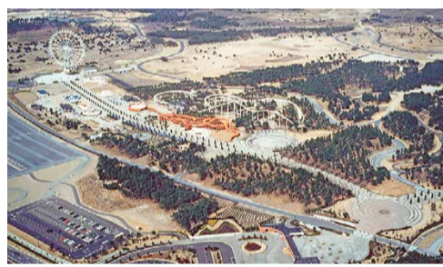
▲平成3年空撮

平成3年10月5日、プレジャーガーデンなど約70ヘクタールが第1期開園。その後、「たまごの森」や「砂丘ガーデン」、「みはらしの丘」などがオープンし、着々とエリアを拡大。現在は、全体計画面積350ヘクタールの内、61%の215ヘクタールが開園されています。