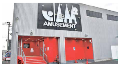
アミューズメントジャムジャム ひたちなか本店 場所：田中後40-11 営業時間：10:00~00:00 問合せ：262-3980

最近は家でオンラインゲームで遊ぶことが多いですが、学生の時には友達とゲームセンターでよく遊びました。特にジャムジャムは思い出の遊び場です。ゲームでは、相手やミッションを攻略するために対策を練る時間が一番好きですね。