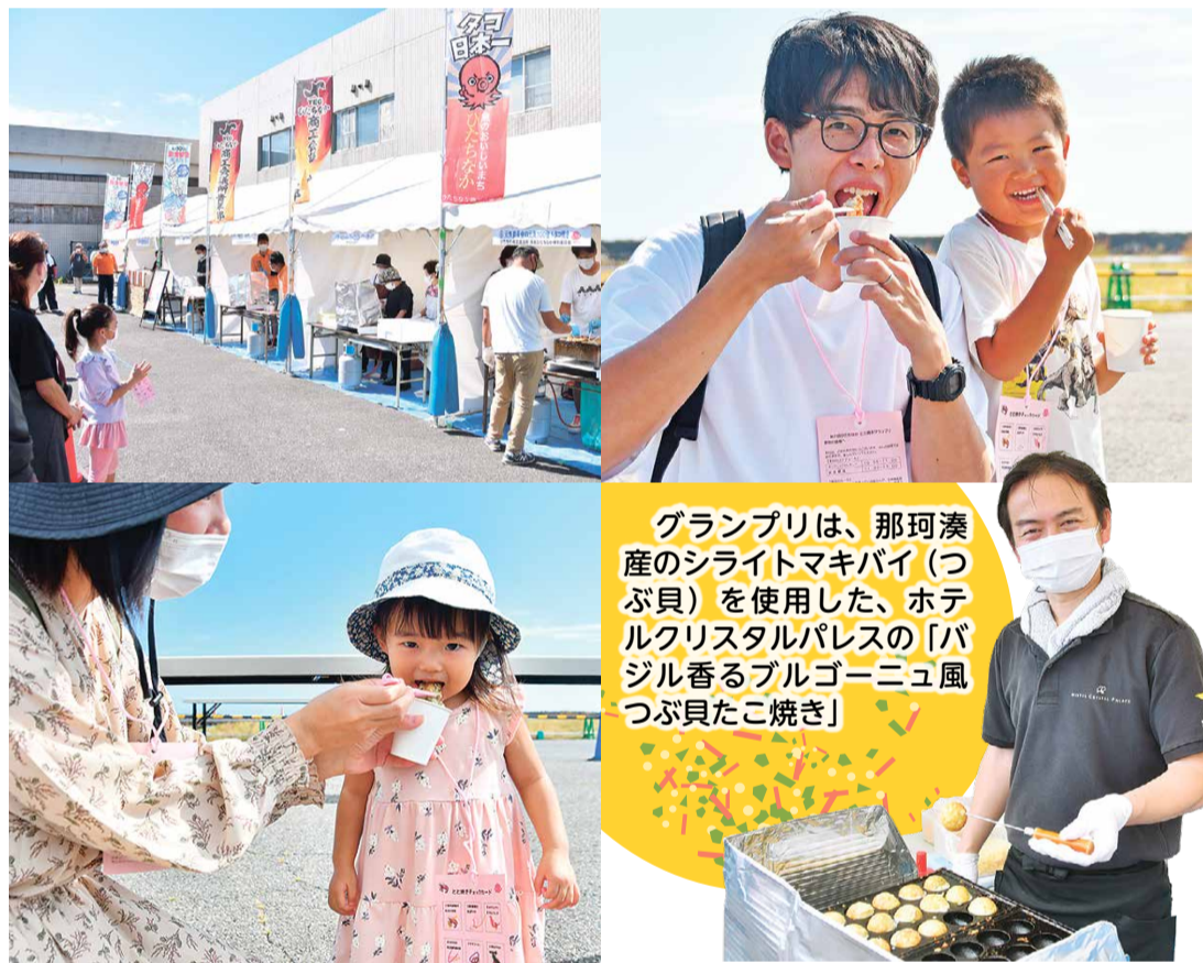
グランプリは、那珂湊産のシライトマキバイ(つぶ貝)を使用した、ホテルクリスタルパレスの「バジル香るブルゴーニュ風つぶ貝たこ焼き」